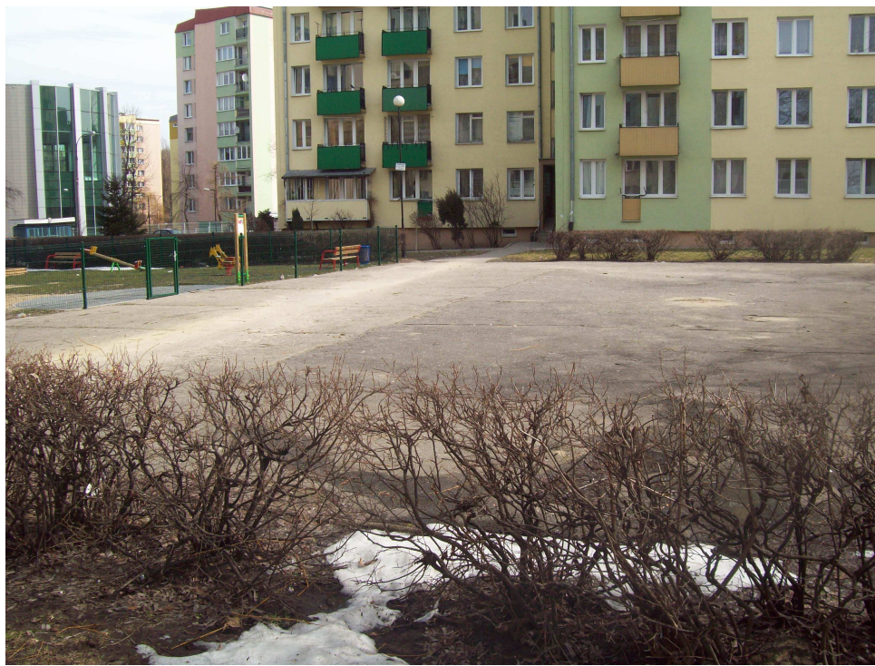
Fot. 1 Widok istniejącego placu asfaltowego przy ul. Glinianej 25-27-29 w Lublinie.

Teren jest oświetlony. Istniejący plac nie spełnia wymogów bezpieczeństwa i estetyki.